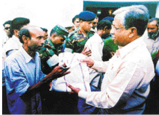
প্রধান উপদেষ্টা ড. ফখরুদ্দীন আহমদ রবিবার জামালপুর জেলার দেওয়ানগঞ্জ উপজেলায় বন্যায় ক্ষতিগ্রস্ত কৃষকদের মধ্যে সার ও সবজি বীজ বিতরণ করেন